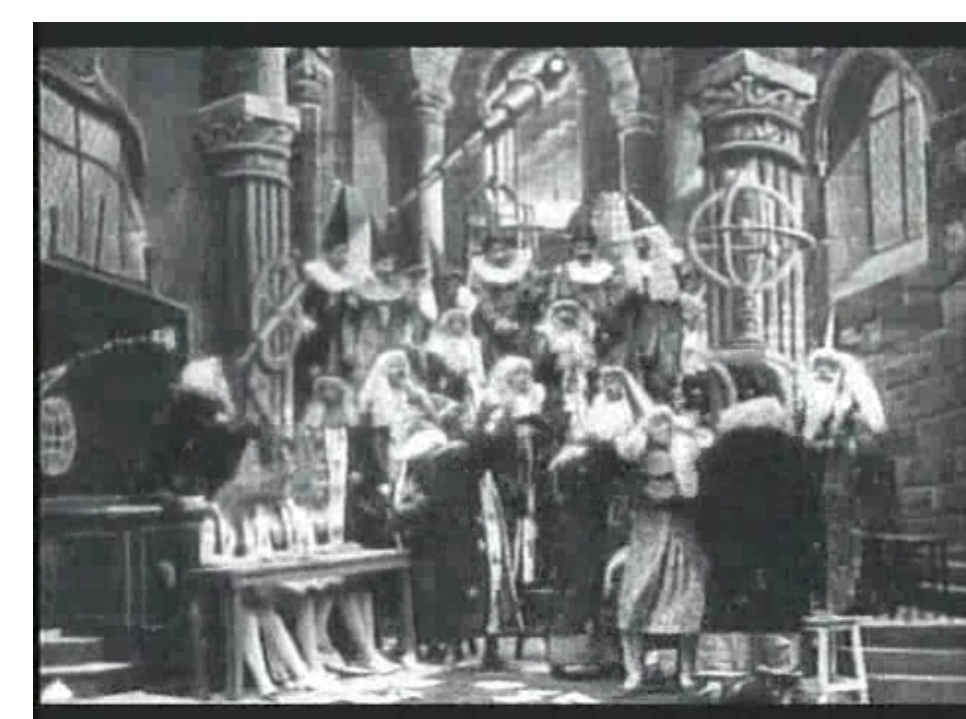
초기 영화쇼트 <달나라 여행>

이를 위하여 하나의 큰 장면을 보여준 뒤, 그 장면의 일부를 확대한 장면 들을 배치했는데, 이것이 데쿠파주 다. 그렇다면 이 영화편집기법 사는 발전한것이 확실한 것일까?